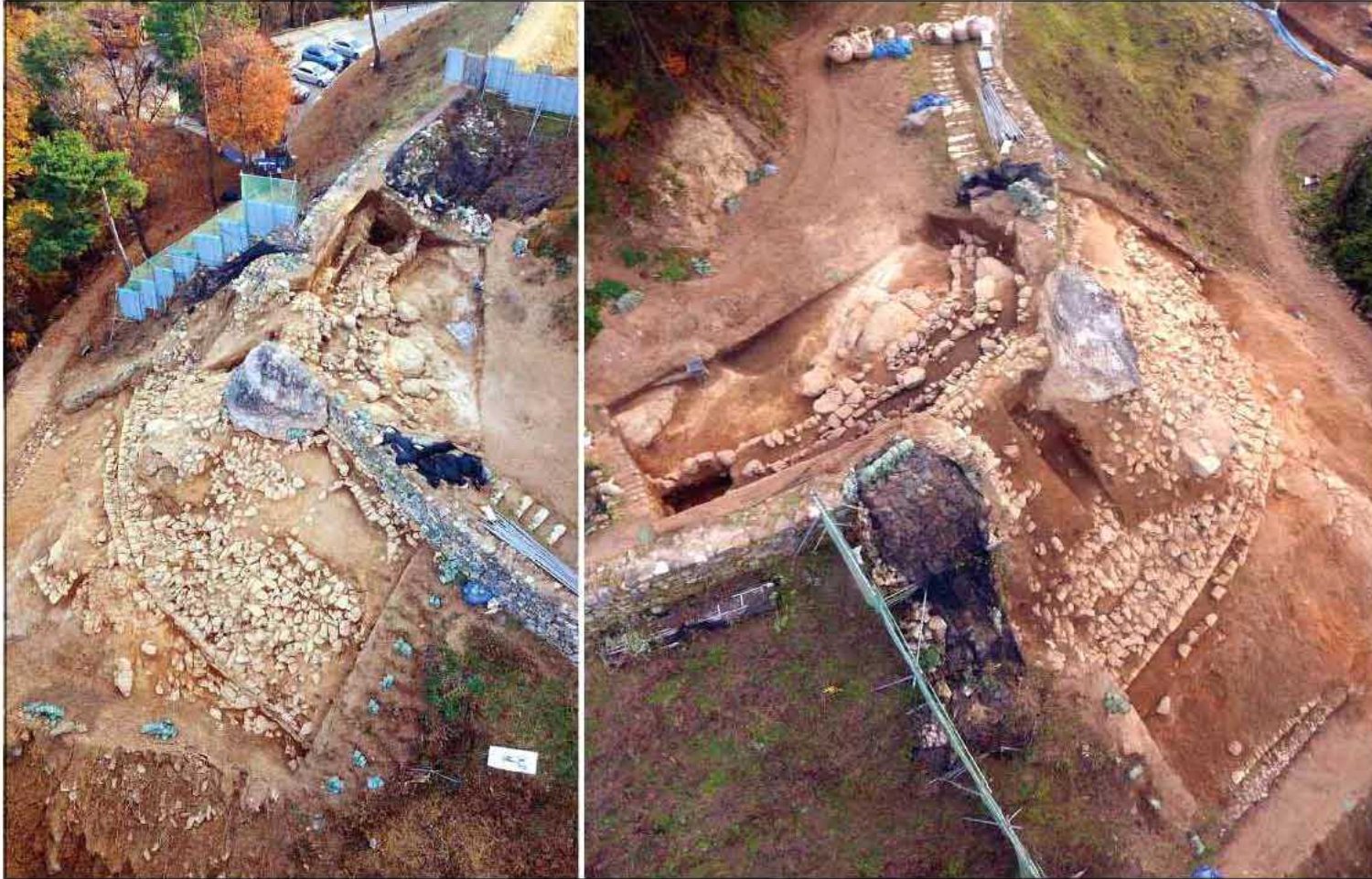
오산 독산성 발굴조사 현장 모습