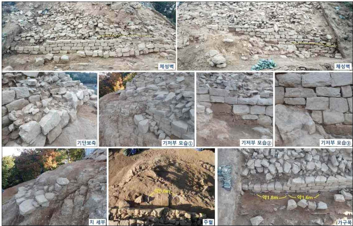
오산 독산성 발굴조사 현장 모습