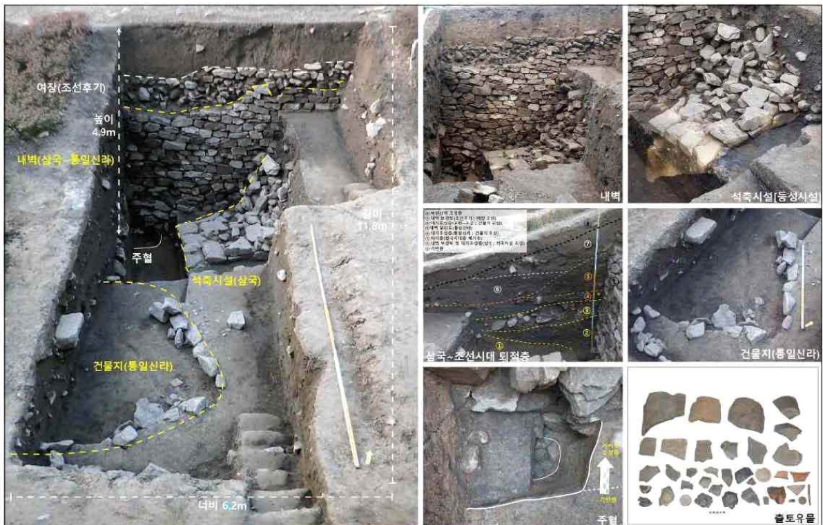
오산 독산성 발굴조사 현장 모습